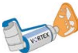
(VORTEX® met babymasker)